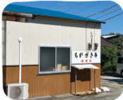
牧場入口にある直売所