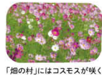
「畑の村」にはコスモスが咲く