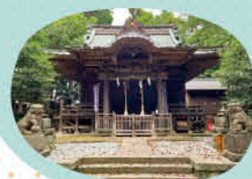
当時の石と伝わる「腰掛玉石」