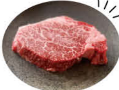
ちがさき牛のヒレ 100g 1,100円

直売所 こま切れ (100g450円)、カルビ (100g650円〜) など家庭用サイズのバックで販売。 ☎ 芹沢397-1 ☎ 51-0128 ☎ 金土日の10時〜17時 📍あり 直売所以外 市内スーパーのマイクラウン、テラスモール内のタカギフーズで販売。