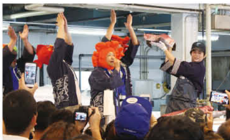
「マグロの踊る解体ショー」の様子

小さいお子様から年配の方まで楽しめるイベントと、大好評のよこすかさかな祭りが3年ぶりに開催される。プールに入って魚に自由にタッチできる「さかなのタッチングプール」や、大きなマグロを音楽に合わせて解体する「マグロの踊る解体ショー」、めずらしい魚の目方(重さ)を当てる「めずらしい魚の目方当てクイズ」などが企画されている。また、横須賀の海の幸が味わえる地産地消グルメコーナー、魚介類の特価朝市、地魚無料試食会など、「食」に関するバラエティ豊かな。ぜひ横須賀魚市場で魚にもっと親しもう!