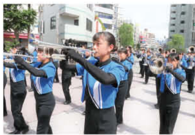
パレードでは迫力あるパフォーマンスが繰り広げられる

9月24日(土)、25日(日)の2日間、藤沢市民まつりが3年ぶりに開催される。藤沢駅周辺では、公募によるステージパフォーマンス、藤沢駅南口・北口での大パレードが行われる。そのほか、物販ブース、ご当地物産展、プロスポーツチームふれあいコーナーなど多彩な内容だ。