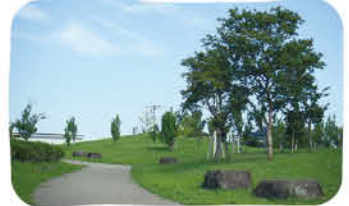
来園者はウォーキングをしたり犬の散歩をしたり