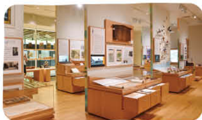
基本展示室は年2、3回展示替え

☎ 堤3786-1 ☎ 81-5607 ☎ 9時〜19時 9月休館日: 9/12.13.14.20.21.26.27 アクセス 茅ヶ崎駅北口からバス「堤坂下」または「湘南みずぎ」下車 徒歩約15分 香川駅からバス「浄見寺入口」下車すぐ 香川駅から徒歩約25分(約2km) ⚠️注意 駐車場は12月完成予定