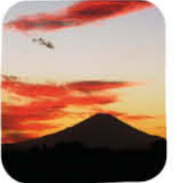
富士山の撮影スポットがある