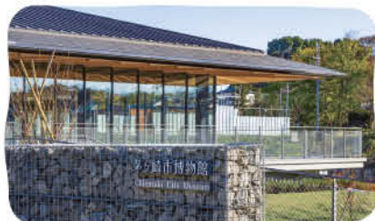
企画展「鎌倉殿」の時代の茅ヶ崎」第2弾も展示(10/23まで)

50年の歴史を持つ茅ヶ崎市文化資料館に代わり、今年7月、自然豊かな堤の地に開館した。海と川と道が交じり合う茅ヶ崎の大地を、海・砂丘・川・低地・丘陵の5つに分け、そこで営まれた人々の暮らしを紹介している。たとえば「海」の展示なら、茅ヶ崎のシンボリック存在のえびし岩について、詳細な模型や人々との歴史的な関わり、生息する生きものなどなどが丁寧に解説される。茅ヶ崎の里山エリアは「丘陵」に属する。同館の展示に触れたら、もっと里山のことが分かるはずだ。