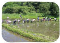
ボランティア団体「里山公園倶楽部」が、田植えや竹林整備、外来種抜き取りなどの作業に従事