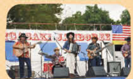
湘南を中心に活躍する10バンド以上が集結

☎ 芹沢1030 ☎ 50-6058 📍あり(一部有料) アクセス 茅ヶ崎駅北口からバス「芹沢入口」下車 徒歩約5分 湘南台駅西口からバス「芹沢入口」下車 徒歩約5分