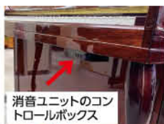
消音ユニットのコントロールボックス

「ご近所に配慮したい」「練習時間が夜になってしまう」などの悩みから、ご自宅のピアノにサイレント機能を付けたいという方が増えています。確かな技術で全国に展開するピアノ専門店「ピアノ百貨」では、消音ピアノに切り替える「消音ユニット取り付けサービス」を実施。取り付けだけで、ヘッドホン練習やスピーカー(別売)から音量調節もできます。標準取付料込みで、14万8,500円〜の特別価格。価格改定前の今がチャンスです。