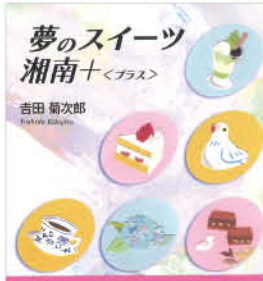
湘南スイーツクルーズ

洋菓子の名店「ブルミッシュ」創業者、吉田菊次郎氏がおすすめる湘南スイーツのガイド。藤沢、江の島、鎌倉、逗子、葉山、小田原、箱根までの名店115店を徹底紹介。スイーツクルーズに出発!