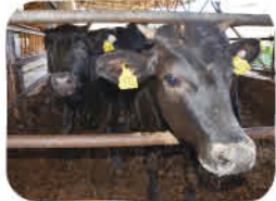
ちがさき牛は黒毛和牛とホルスタインをかけた交雑種