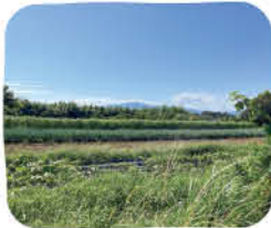
美しい里山の風景