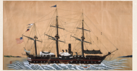
横須賀に來航した黒船

明治17年になると、それまで横浜にあった東海鎮 守府(海軍の司令部)が横須賀に移り、横須賀鎮守府と なりました。ここに軍都横須賀がついに誕生したわけ です。このときの鎮守府の建物は関東大震災で倒壊、 2代目は現在、米海軍司令部の建物になっています。