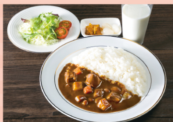
サラダと牛乳を添えるのが提供のルール