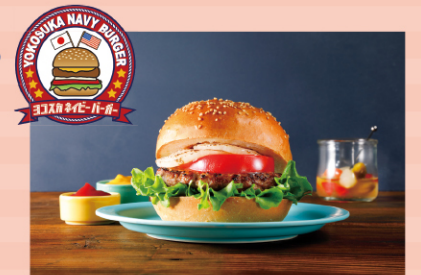
100%ビーフのビッグなサイズ、シンプルな味つけ が特徴

平成20年、米海軍伝統の牛肉本 来の味が際立つハンバーガーのレ シピが、在日米海軍司令官から横 須賀市に贈呈されたのだ。このレシ ピをもとにしたハンバーガーを「ヨ コスカネイビーバーガー」と名付け、 基地周辺の店舗で販売されている。