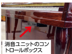
消音ユニットのコントロールボックス

「ご近所に配慮したい」「練習 時間が夜になってしまう」などのお 悩みから、ご自宅のピアノにサイ レント機能を付けたいという方が増 えています。確かな技術で全国に 展開するピアノ専門店「ピアノ百貨」では、消音ピアノに切り 替える「消音ユニット取り付けサービス」を実施。取り付け るだけで、ヘッドホン練習やスピーカー(別売)から音量 調節もできます。訪問取付料込みで、18万7,000円~の 特別価格でキャンペーン中。6/30(金)まで。