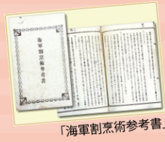
「海軍割烹術参考書」

ほぼ撲滅することができたという。 明治41年に発行された「海軍割 烹術参考書」には、当時日本海軍 で調理されていたカレーライスの作 り方について記載がある。そのレシ ピをもとに復元したのが「よこすか 海軍カレー」だ。市内各所で食べ ることができる。