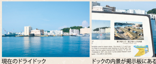
現在のドライドック

行う大工場・横須賀製鉄所(のちに造船所に改称) の建設が始まりました。建物に使うレンガも製鉄 所内でつくり、周囲にはフランス人技術者らの住 宅を建設、近代水道も整備されました。製鉄所周 囲はまるで西洋文明の宝庫のようで、一度は見学 したいと人々の注目を集めたのです。明治4年 には我が国初の石造りのドライドック(艦船を修理す る施設)第1号が完成しました。現在のヴェルニー 公園の向かい側です。このドックは今も現役で使 われていますよ。