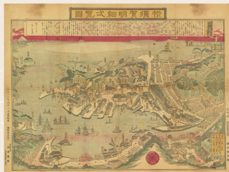
横須賀明細一覽図 明治18年/個人蔵 観光客へのお土産として配られていた

昔のエピソードと現在がところどころでつなが っている…海軍と横須賀の歴史めぐりはたくさんの 魅力と発見がありますよ。