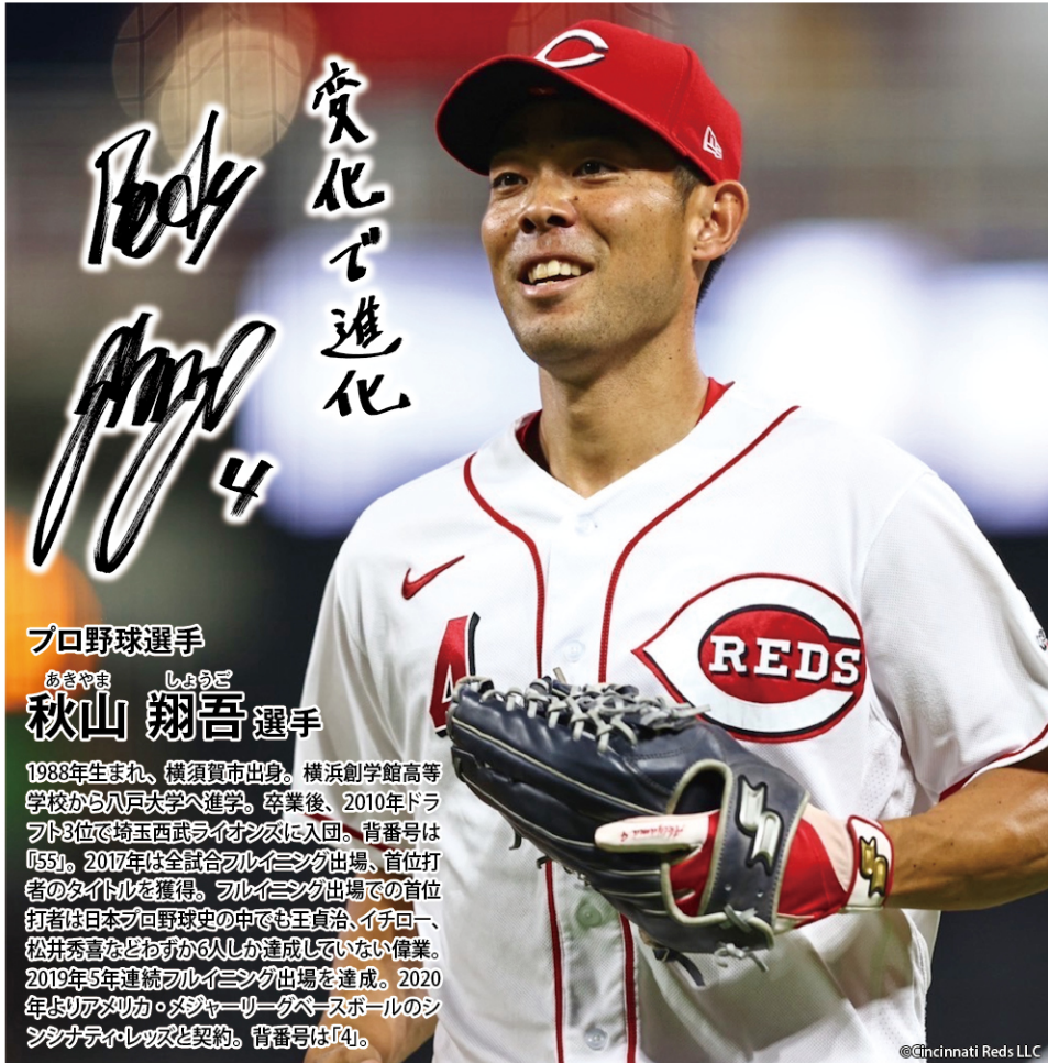
プロ野球選手 あきやま しょうご 秋山 翔吾 選手

幼いころからメジャーに挑戦したいと思っていたわけではなく、選手としてやっていくうちに、挑戦できるチャンスがあるならやってみたいという気持ちが徐々に湧き上がってきました。その中でも大きなきっかけとなったのは、2017年のワールド・ベースボール・クラ