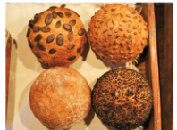
オーガニック全粒粉丸パン

店のイチオシは「風土カンパーニュ」。小麦とライ麦の全粒粉入り生地の香ばしさ、自家製酵母ならではの深い味わいがたまらない。カリふわ食感が魅力の「オーガニック全粒粉丸パン」はプレーン、ひまわりの種、かぼちゃの種、黒ごまの4種類。また、「タンドリーチキンサンド」をはじめ、注文後に作ってくれるサンドメニューも充実している。