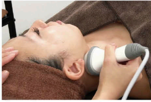
②キャビテーション脂肪分解フェイシャル