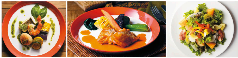
海の幸のグリル バジルスソース 1,980円 国産鶏のグリル レッドカレーソース 1,290円 ビタミンCたっぷりフルーツサラダ はちみつヨーグルトドレッシング和え 880円