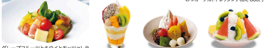
グレープフルーツとキウイとモッツァレラのカプレーゼ 490円 南国パフェ 730円 クリームあんみつ 680円 フルーツ練乳水 930円 ※価格は税別