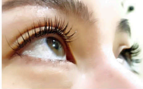
③ナチュラルにボリュームアップ♡まつ毛エクステ

0120-76-2552 三浦郡葉山町堀内 1991-2F 9:30~19:00 有火曜定休