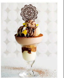
ショコラとバナナのパフェ 3種のアイス 1,250円(税込)

「おしゃれでおいしくておもしろい」パフェ専門店が、6月17日(土)新逗子にオープン!こだわりの自家製アイスとフルーツを彩る鉛細工やチョコレートの飾りは、写真に残したくなるアートな一品。最高のパフェをお楽しみください。