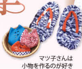
マツ子さんは小物を作るのが好き