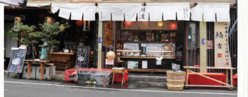
小田原かまぼこ発祥の店 鯛吉(うろこぎ)

北条氏の時代から「船方利」と呼ばれ、かまぼこや干物、削り節などの水産加工業の集積地として栄えた。小田原宿に宿泊する旅人や箱根の湯治客への食糧用としてかまぼこが普及したとも言われている。