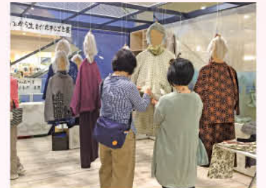
昨年5月、ふたりの作品を展示した「もったいないから生まれた手しごと展」