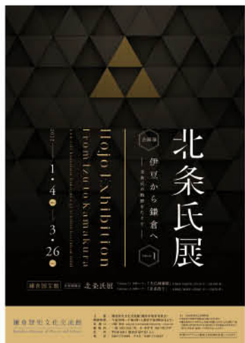
この1年は中世の世界にどっぷり浸ろう!

◆日 時／1月4日(火)～3月26日(土) 10時～16時(入館は15時30分まで) ◆場 所／鎌倉歴史文化交流館(鎌倉駅西口より徒歩約7分) ◆休館日／日曜・祝日 ◆観覧料／一般300円、小・中学生100円 ◆問合せ／☎0467(73)8501 ※鎌倉国宝館でも「北条氏展」を同時開催。1月4日(火)～2月13日(日) 企画コーナー「大仏師運慶」