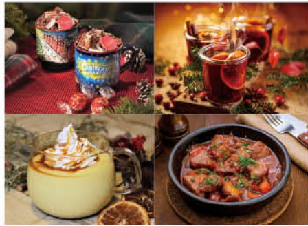
寒い季節だからこそ味わいたいメニューがずらり

◆日時／～12月25日(土) 11時～21時 (12/11(土)～12/25(土)は22時まで) ◆場所／横浜赤レンガ倉庫 イベント広場、赤レンガパーク ◆料金／無料(飲食、物販代別途) ※12/11(土)～12/25(土)までの土・日曜日と 12/23(木)・12/24(金)は300円(要事前予約) 予約サイト↓ https://yokohamaredbrick.peatix.com/ 予約サポート窓口↓ ☎0120(777)581(受付時間:平日10時～18時)