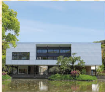
大河ドラマ館が開設される鎌倉文華館