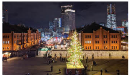
大きなツリーを中心とした会場イメージ。本場の世界観を体験できる!

グルメのおすすめはスパイスの効いた温かいワイン「グリュウワイン」や豚肉を香味野菜とともに煮込んだ「アイスバイン」。いずれもドイツの定番料理だ。また、プレミアムチョコレートブランド「リンツ」やファーストクラスの機内食の監修・料理を手掛ける「ワールドフレイバー」が初出店する。自分だけのスノードームを作るワークショップやラッピング体験も開催。大切な人への思いを形にしてみよう。