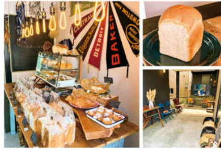
(左)アメリカンテイストの店内。(右)人気の塩麹食パン。(右下)ガラージでイートインが可能。ワンちゃん連れもOKだ