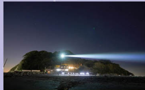
JIKU #004_v2022 SARUSHIMA / 齋藤 精一 / Sense Island 2022