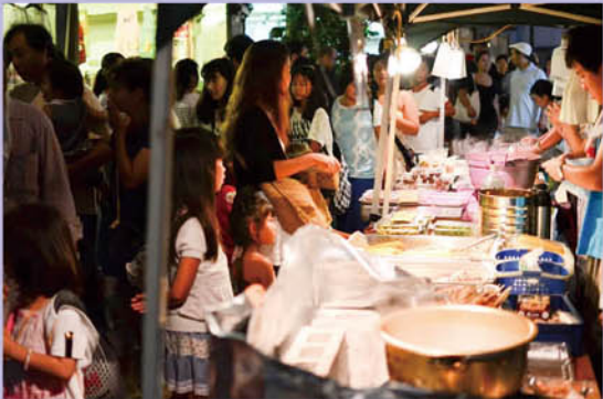
三崎下町は昭和の雰囲気が色濃くいエリアだ