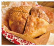
ローズマリーのフォカッチャ

店の定番商品「塩麹食パン」はトーストして食べるのがおすすめ。サクッと香ばしく、毎日食べても飽きがこない。「ローズマリーのフォカッチャ」はもちりもちりとした生地のおいしさが際立つ一品だ。また、子どもたちに大人気なのが、手のひらサイズのミニ食パン。「ぶどう」や「メープル」など数種類あり、生地がもちりもちりと緻密で食べ応えがある。