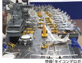
空母「タイコンデロガ」

全国各地の艦船模型製作の愛好家が、自慢の作品を持ち寄り披露する国内最大級の展示会。約500点を展示する。ぜひ足を運んでみよう。