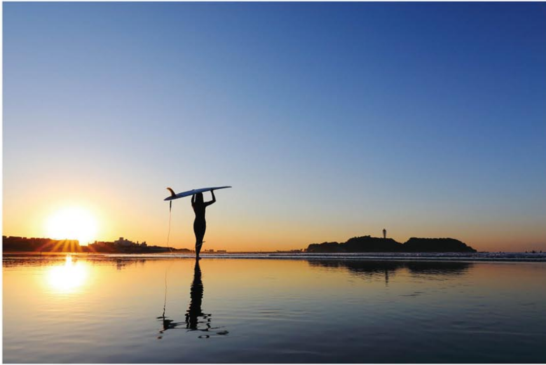
秋の鵠沼海岸の日の出

湘南を代表するフォトグラファー・市川紀元さん。30年にわたり湘南を撮り続けてきた。その珠玉の作品の数々は決して偶然の賜物ではなく、湘南をこよなく愛し海を見つめ続けてきた市川さんだからこそ生み出せたもの。市川さんの湘南への想いは、海よりも深い。