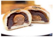
“ちょい食べ”のあんぱん

《お申込み》 はこねツアーズ(9時30分~17時) FAX 0460 (85) 8321 はこねツアーズ