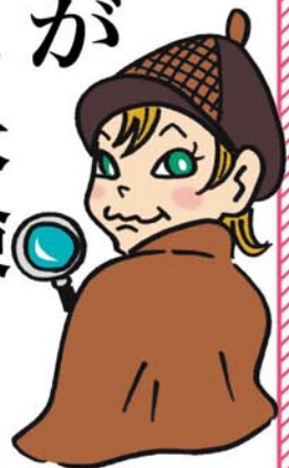
(情報誌 LaVita で紹介されました)