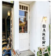
英国調の白い扉が目印

鎌倉・由比が浜大通りにある「みゆきパン」は週に2~3日だけ営業する小さな店だ。野生酵母や海洋酵母を使い、おいしくて体にいいパンを丁寧に作る。それがみゆきパンのスタイルだ。