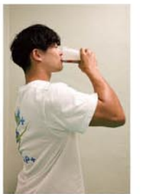
プロテインでしっかり補給

そして運動後はゴールデンタイムに突入です。筋肉の合成を最大化させて、体力アップで健康長寿!