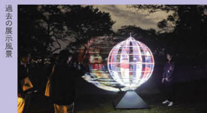
過去の展示風景

猿島は東京湾に浮かぶ無人島、島内には江戸から明治期の砲台跡がいくつも残る。そんな猿島を舞台に2019年に始まったアートイベント。夜の静寂と暗闇を感じながら、島に点在するアート作品を通じて人間本来の感覚を取り戻す試みが、今年は横須賀の市街地・日中へと拡張して開催される。参加アーティストは、碓井ゆい、キュンチョメ、齋藤精一ら。舞踊家・梅川壱ノ介、シンガー・寺尾沙穂らのパフォーマンスやワークショップも予定されている(チケット購入要)。