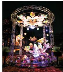
MIRROR BOWLER 光 ART

また、江島神社と鎌倉・円覚寺との60年に一度行われる合同例祭「洪鐘祭」の令和5年に開催された様子を多摩美術大学学生が絵巻にした展示も。令和の洪鐘祭が蘇る絵巻は圧巻だ。