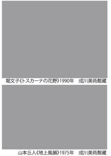
堀文子《トスカーナの花野》1990年 成川美術館蔵

日 時 / 4月19日(土)~6月22日(日) 10時~18時 ※休館日: 5月12日(月)、6月2日(月) 場 所 / 横須賀美術館 料 金 / 一般1,300円ほか(中学生以下、市内在住・在学の高校生は無料) 問合せ / ☎046(822)4000 横須賀市コールセンター