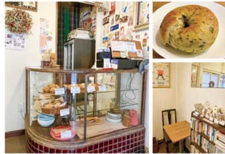
無添加北海道産小麦を使用。ベーグルのほかマフィンやビスケットも。(右上)人気の「草もち」。(右下)カフェの営業は13時~17時