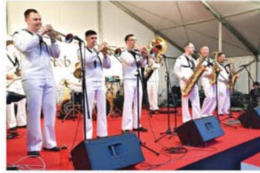
来場者も大盛り上がりのステージ演奏

日 時 / 4月11日(金)~20日(日) 平日15時~21時、 土日11時~21時(L.O.はいずれも20時45分) ※荒天中止 場 所 / ヴェルニー公園 料 金 / 入場無料(飲食などは有料) 主 催 / 横須賀オクトーバーフェスト実行委員会