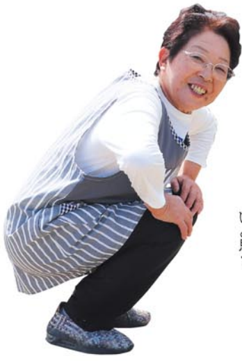
一時は関節が変形していたのだが…