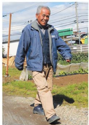
酷使して悲鳴を上げた両ひざが見事に…!