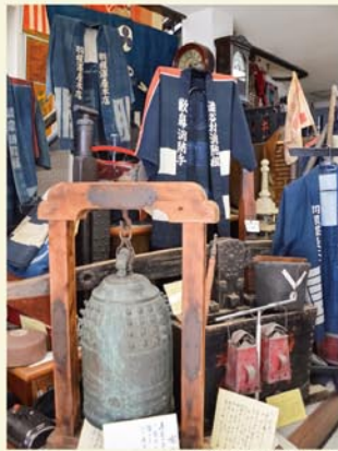
消防団の半纏と喚鐘

消防団の半纏からは、長後が明治の頃は渋谷町渋谷村の藪鼻という地名だったのが分かる。長後は、江戸時代から交通の要衝で、養蚕が盛んだった。製糸工場もあり、街道は生糸を運ぶ道としても賑わっていた。糸車や製糸業の機械、街