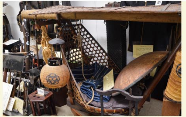
宿場籠。座面は小さく、当時の人は小柄だったのだから