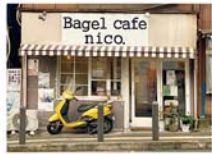
レトロで風情ある外観

京急・横須賀中央駅西口から坂を上り、3分ほどで「ベーグルカフェニコ」に到着する。創作ベーグルの