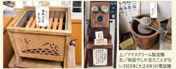
お座敷用氷柱冷房器