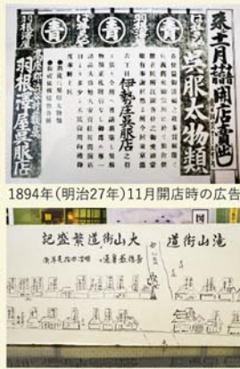
1908年(明治41年)頃の街道図