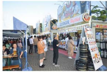
開放感のある会場でビールを飲み比べよう

会場内に設置される特別シート(要予約・有料席)では地元水産会社セレクションの海鮮BBQとドイツビール飲み放題を楽しめるプランや、平日限定で1,000円(税込)で350mlのビール(ソフトドリンクも可)とおつまみ1品がセットになったお得なハッピーアワークーポンの販売も。春の陽気に包まれながら、ドイツビールと絶品グルメを満喫しよう!